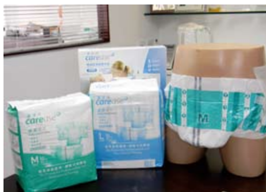
電子感濕尿片將陸續推出附加功能，以迎合市場需求。