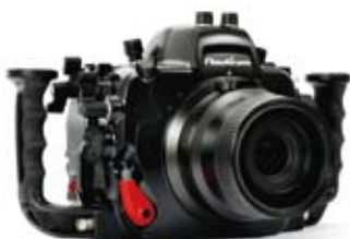
藍天海單反防水相機殼