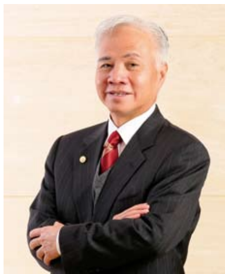
香港中華總商會會長楊釗博士

他又指出，《基本法》確保香港實行自由貿易政策，並繼續以單獨關稅地區名義，參加國際貿易組織和簽訂國際貿易協定，與眾多國家及地區保持緊密經貿往來。內地與香港簽署