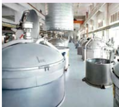
Superwin單向筒子紗染色機