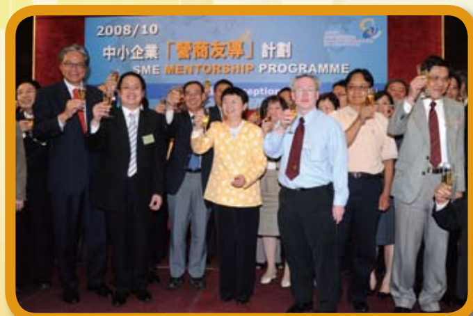
工業貿易署署長關錫寧女士帶領協辦機構代表及導師祝酒。