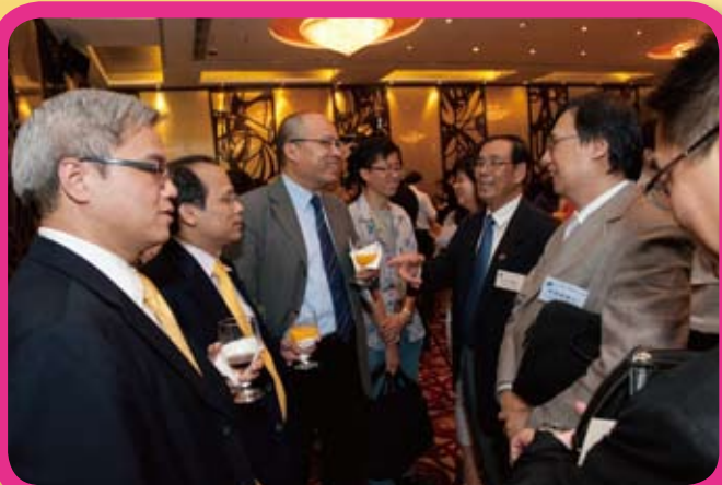
酒會嘉賓互相交流和分享心得。