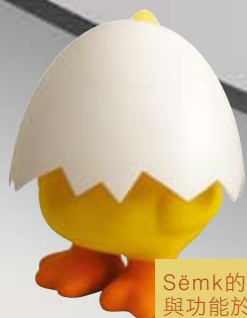
Sëmk的產品都集設計與功能於一身，為客人的生活增添趣味。