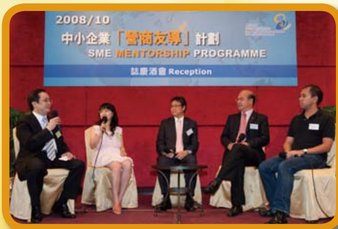
導師和學員代表在台上暢談參加中小企業「營商友導」計劃的經驗和感受。