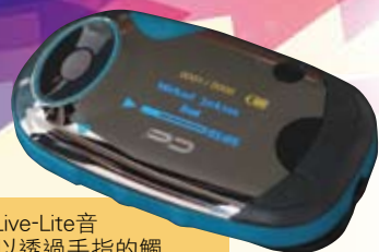
幻音數碼的Live-Lite音樂播放器可以透過手指的觸摸準確地量度心率，以及步行距離和步數。