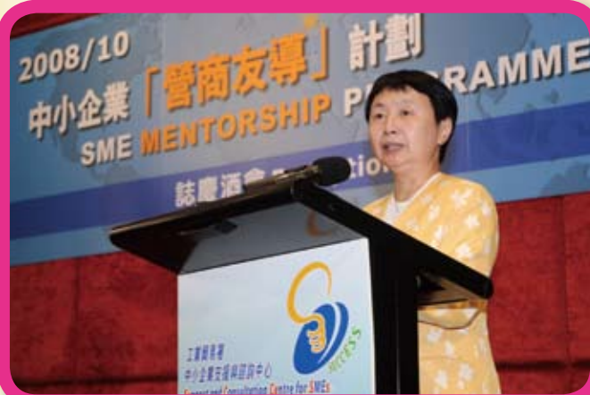
工業貿易署署長關錫寧女士致辭，總結2008/10中小企業「營商友導」計劃的成績。

2008/10年度中小企業「營商友導」計劃已於2010年6月順利完成。參與的學員共有193位；而協辦機構的數目亦達61家，涵蓋不同範疇的工商組織、專業及學術團體，共提名135位資深企業家和專業人士擔任導師。為答謝各合作伙伴對計劃的鼎力支持，SUCCESS特於8月20日舉辦2008/10中小企業「營商友導」計劃誌慶酒會，由工業貿易署署長關錫寧女士頒發感謝狀予協辦機構代表，並勉勵學員在完成計劃後延續與導師「亦師亦友」的關係；一班導師和學員代表亦在台上分享參加計劃的經驗和感受。超過140位協辦機構代表、導師、學員和SUCCESS友好在酒會上互相交流和分享心得，氣氛非常熱鬧。