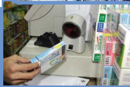
使用電子銷售點掃描系統毋須反覆輸入銷售價目，確保數據準確無誤。