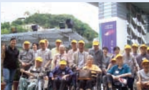
頌恩護理院為院友提供各類的興趣班及戶外活動。

伍院長指出：「滿足客人要求非常困難，皆因長者各有不同性格，可能會有無理要求，但我們會盡力改進服務，令大部份長者滿意。護理員的流失是另一個難題，政府資助院舍的工資比我們高，為了挽留人才，我向員工解釋本院以低成本提供高質素服務的宗旨，同時很關注他們的需要，安排客戶服務培訓及電腦課程，又舉辦活動，加強員工的歸屬感。」