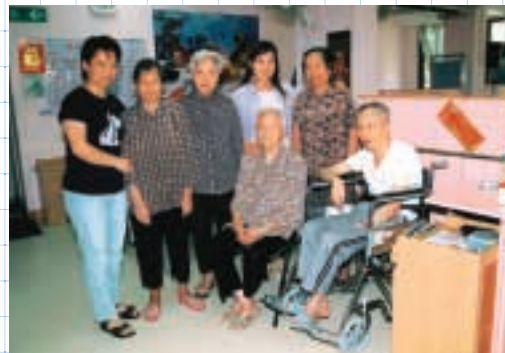
耆英美滿護老院以清潔、自然、實力及愛心招徠客人。

但欠缺資金。幸好有一位專業人士在做過市場調查及訪問超過100家安老院後，最近決定注資耆英美滿護老院，在現址附近開設分院。她預計在擴充規模後，便可取得利潤。