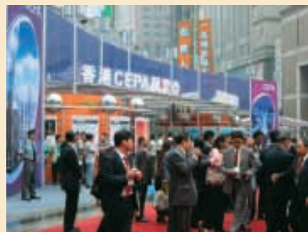
香港CEPA展覽會的盛況