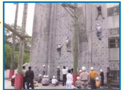
在發揮團隊精神和互相鼓勵的推動下，各學員都能突破自我，完成目標。

今年4至5月期間，SUCCESS聯同兩間專業培訓機構為學員安排了4個培訓課程，課程分為「領導才能訓練」及「財務管理訓練」兩大類。當中一項「領導才能發展課程」是透過體驗式學習，幫助學員突破自我，掌握創意思維和解決難題的竅門。內容包括分組活動、討論和經驗分享等環節，其中最具挑戰性是攀石練習。部份學員起初不敢嘗試，但在其他組員鼓勵下最終都能成功攀上目標。在此過程中學員除增強自信外，更體驗到團隊互信互助的重要性。