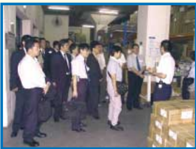
學員參觀各種儲存設施。