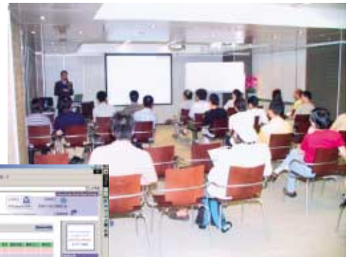
香港Linux資源中心不時舉行講座