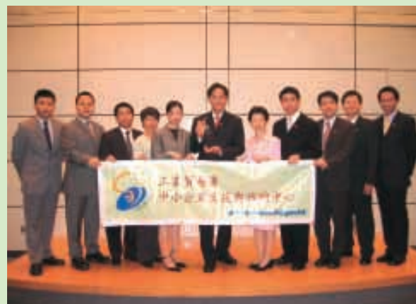
工業貿易署助理署長魏永捷率領SUCCESS同事領取冠軍獎座

能夠獲得這項殊榮，實有賴各位中小企朋友及支援團體對SUCCESS服務提出的寶貴建議，以及對SUCCESS各員工的支持和鼓勵，在此我們要向各位致以無限感謝。我們將會繼續秉承「以客為本」的精神，全心全意為中小企業人士服務。