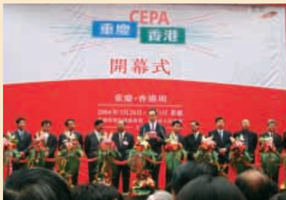
財政司司長唐英年在「重慶·香港周」開幕儀式上致辭

「重慶·香港周」以CEPA為主題，工貿代表團的活動包括「渝港中小企業交流研討會」，會上雙方代表進行交流洽商，渝港兩地的中小企協會更趁此機會簽訂了合作協議。代表團亦參觀了重慶的工業園區、經濟開發區、以及當地的重點企業包括摩托車、汽車、藥物、乳品及啤酒等企業。