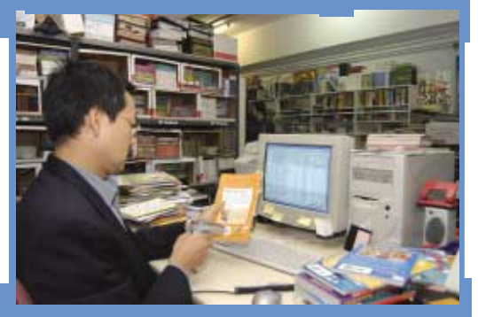
引進自動化系統後，員工出入貨更加得心應手。

12位中小企大使引進自動化系統的故事，以及一套由專業顧問撰寫的行業實施指引將於今年年底出版，有興趣人士請聯絡香港貨品編碼協會(電話：2863 9724，傳真：2861 2423，電郵：info@hkana.org)。