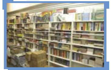
使用自動化系統前