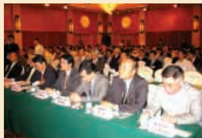
渝港中小企業交流研討會的情況